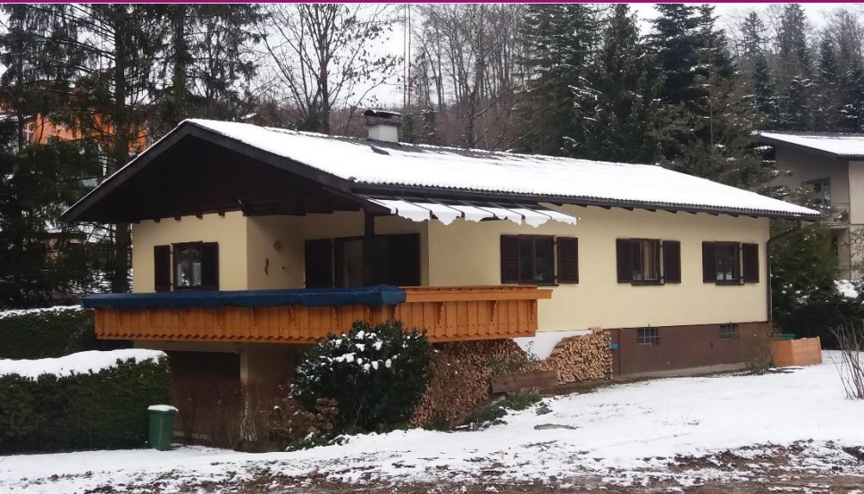
Waldweg 4 Gmunden